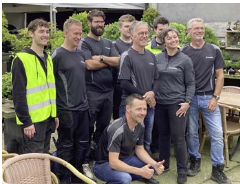
Het team van Nobilis die beide dagen tot in de puntjes had verzorgd.