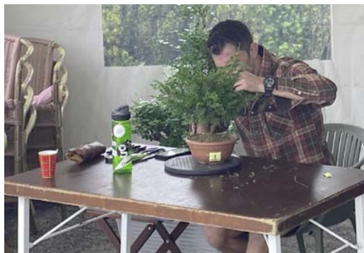
De NTC van Bonsai vereniging Apeldoorn waar er totaal 4 personen bezig waren om in 3 uur een prachtige Juniperus bonsai te creëren.