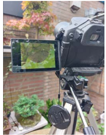
Hoe maak je daar een foto van?

Het vooruitzicht is dat de kolonie in augustus – september zal doodgaan. Alleen de (nieuwe) koningin zal de winter overleven. En zij zal dan volgend jaar weer een nieuw nestje maken. Hopelijk dan toch gewoon in een boom in de tuin.