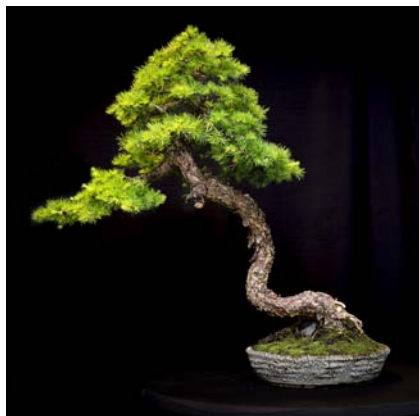
nominatie beste naaldboom