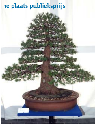
1e plaats publieksprijs