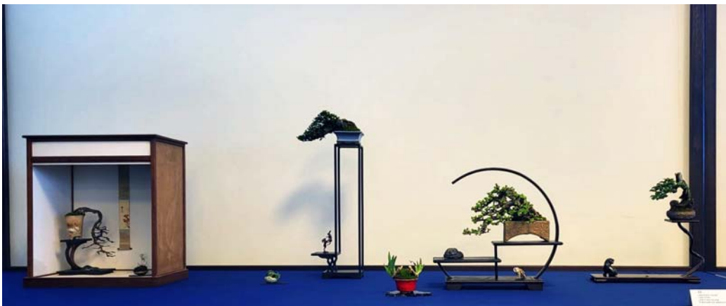
3e plaats publieksprijs