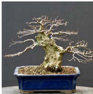
Onderste takken verwijderd.

December: enkele lange uitlopers wat ingekort en de gok genomen om de voor de uiteindelijke vorm overvloedige onderste takken te verwijderen.