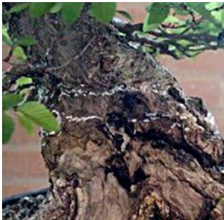
Schors en cambium zal tussen de onderste en bovenste krijtlijnen worden verwijderd

Ondanks dat er veel wortels zichtbaar waren en de 'pot' vermoedelijk was volgegroeid met wortels wachtten we toch met het scheiden van de marcot van de onder- stam. Het groeiseizoen was nog in volle gang en het was moeilijk in te schatten of de boom, vol in het loof, wel kon overleven op de wortels van de marcot. We besloten de onderstam en marcot pas te scheiden als de boom in rust was, het blad was gevallen en de boom dus alle voedingsstoffen voor het volgende jaar uit het blad had opgeslagen in zijn stam.