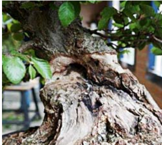
Bast en cambium zijn verwijderd tussen de krijtstrepen

Tenslotte hebben we rondom de stam als 'pot' een wortelnetje aangebracht en gevuld met een mengsel van akadama en fijn gemaakte sphagnum om de stam wortel te laten schieten vanuit de bovenste aansnijding van de stam.