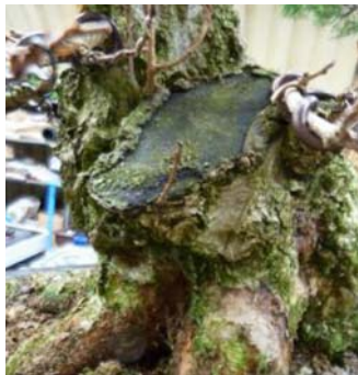
December 2008. Een yamadori met potentie, én met een lastige wortelvoet ...