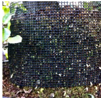
Een netje is geplaatst en gevuld met akadama & sphagnum

Om wortelgroei te bevorderen werd de bovenste rand (waar de nieuwe wortels moeten groeien)