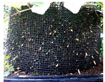
Groeipunten van wortels zichtbaar