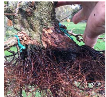
Loszittende schors verwijderd.

Op een aantal plaatsen op de wortelvoet liet de schors los. Hopelijk ten gevolge van de nieuwe groei. De loszittende schors werd voorzichtig verwijderd om de laag er onder te bekijken. Die leek intact en levend.