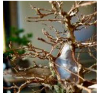
November 2011. Wond gedicht

Een grote zaagwond in de top werd schoongemaakt en afgedicht (2011) met 2-componenten pasta om dicht te kunnen groeien.