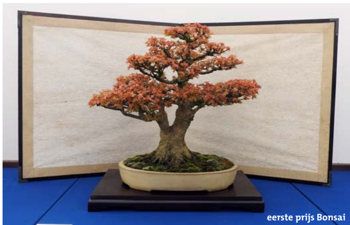
eerste prijs Bonsai