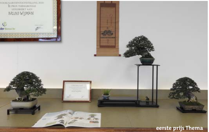
eerste prijs Thema