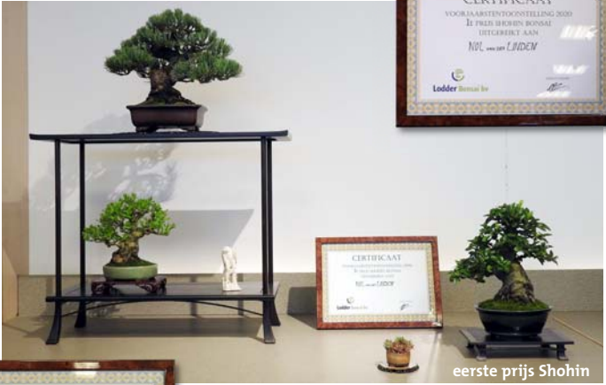
eerste prijs Shohin