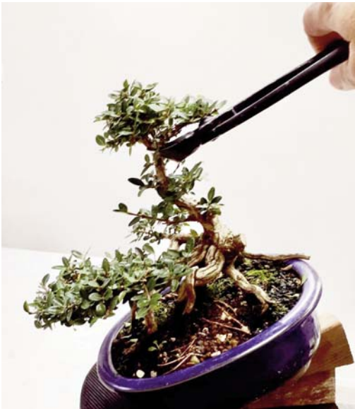
6 Daar gebruik ik weer de concaaftang voor.