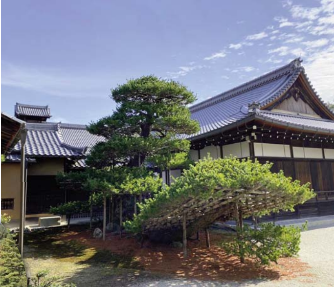
Gouden Paviljoen en andere belangrijke gebouwen van de shōgun zich op de Noordelijke Berg (Kita Yama) bevinden.

verdieping bevat de relieken van de Boeddha en een altaar voor de Bodhisattva van de genade, de Bosatsu Kannon. De derde verdieping is gebouwd volgens de regels van de Zen-zukuri. Dit kun je goed zien aan de ramen, die de vorm hebben van een tempelklok. Deze verdieping werd toegevoegd in de Japanse middeleeuwen, tijdens de Muromachi-periode (1336 tot 1573). In deze periode was het Zen-boeddhisme namelijk zeer invloedrijk.