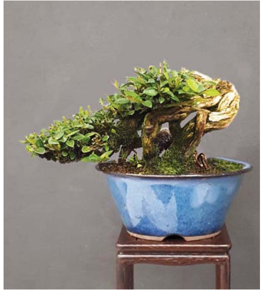
13 De stand die de boom uiteindelijk zal krijgen in de pot, 8 cm hoog! (fotomontage)