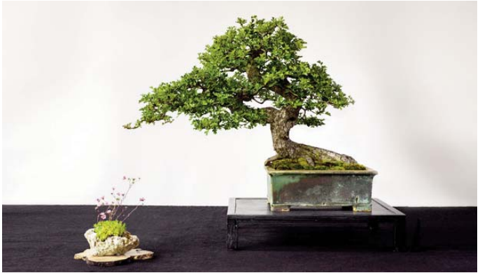
Beste loofboom: Crataegus, Bonsaihut Perry Benninck

Lever iets in dat in de volgende nieuwsbrief geplaatst kan worden! Een stukje tekst, misschien een mooie foto erbij, een fotoreportage ... alles kan ... Zet hem op!