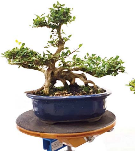
14 De Lonicera bij aanvang van het werk.