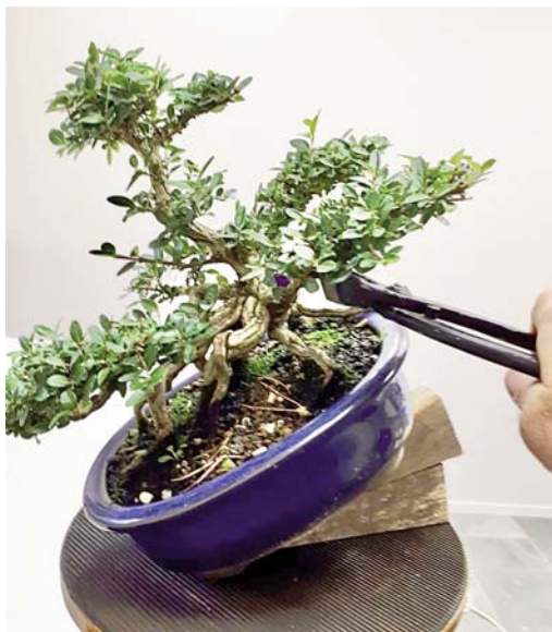
2 Bij het bepalen van de nieuwe voorzijde en hellingshoek wordt het duidelijk wat er gebeuren moet. De onderste tak komt nu wel erg omhoog.