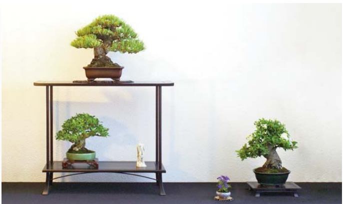
Beste shohin: Pinus parviflora, Ligustrum japonica, Pyracantha angustifolia, Midden Nederland Nol van der Linden