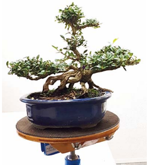
5 Die top moet er natuurlijk ook af.