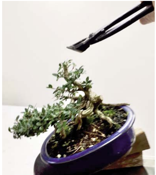
7 Dat ziet er ook al beter uit zo.