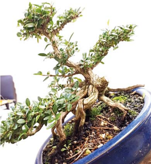
4 Dat is al beter