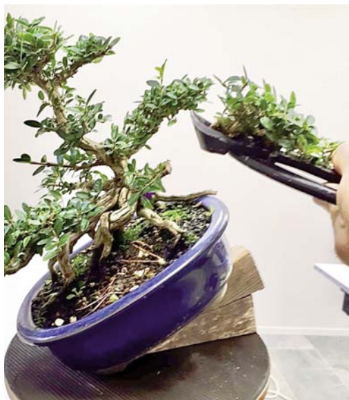
3 Die kan weg. Geen probleem voor een goede concaaftang.