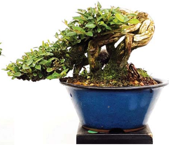
15 Het resultaat tot nu toe.