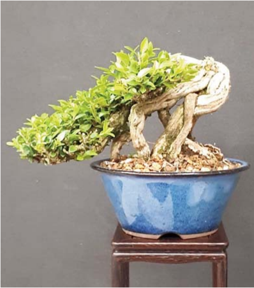
12 De nieuwe uitloop teruggesnoeid.