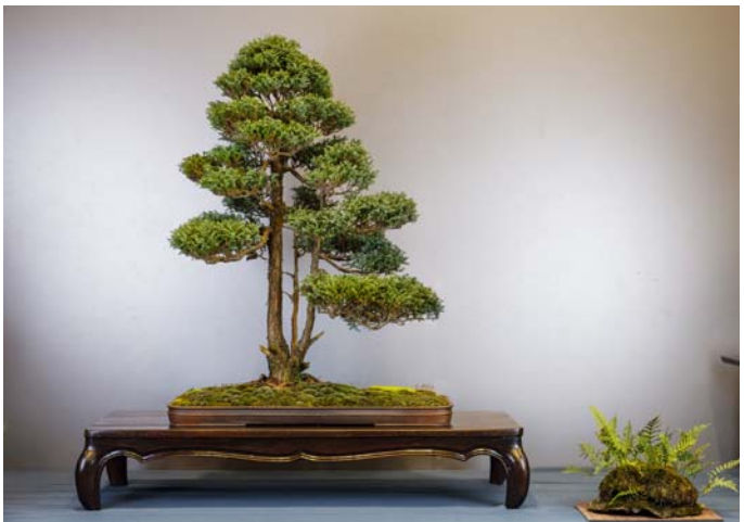
April Show 2024, na de laatste verpotting bij Bruno