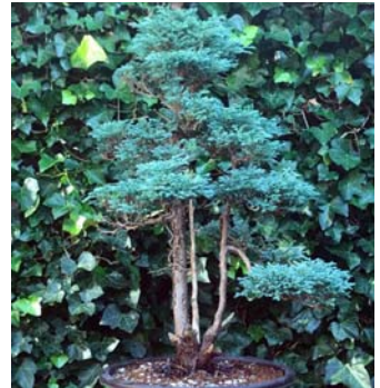
In trainingspot nadat kleinste stam is doodgegaan