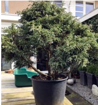
Net na de aankoop in 2017