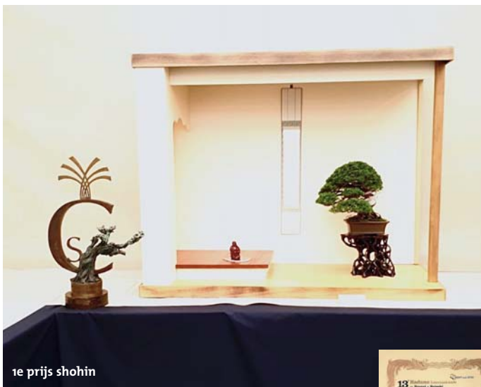
1e prijs shohin