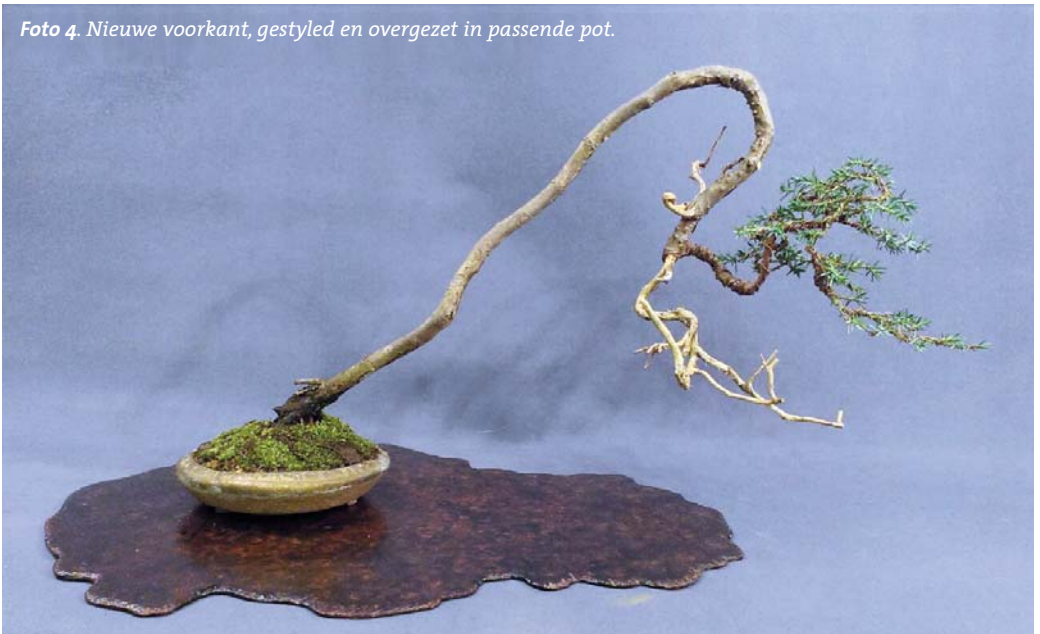
Foto 4. Nieuwe voorkant, gestyled en overgezet in passende pot.