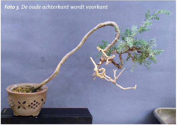
Foto 3. De oude achterkant wordt voorkant