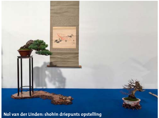
Nol van der Linden: shohin driepunts opstelling