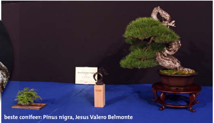
beste conifeer: Pinus nigra, Jesus Valero Belmonte