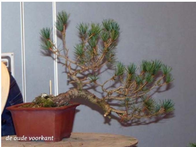
de oude voorkant

Bij aanvang van de demo, leg ik uit wat de voor en nadelen zijn van de beide (voorkant) opties. Ik kies dus de achterkant als voorkant. Van enkelen was het wegsnoeien van het onderste gedeelte van de karaktertak een schrikmoment. Na het knippen van de oude naalden, het bedraden en in de vorm zetten van de boom werd het toch wel begrepen en het mij vergeven. Het in de vorm zetten heb ik met