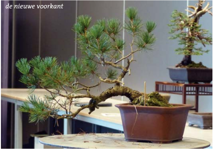
de nieuwe voorkant

kijker toe. Dit met zowel de stam als de onderste 2 zijtakken. De wortelvoet is daarentegen, met de huidige voorkant, verstopt onder de grond. Indien de achterkant voorkant kan zijn, is de wortelvoet gigantisch (pot diameter vullend). De consequentie is dan wel dat de helft van de lange eerste tak (karaktertak) verwijderd dient te worden. Deze gaat dan namelijk helemaal van de kijker